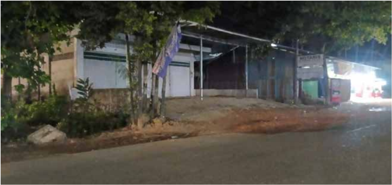
Jalan Projakal, Kelurahan Graha Indah yang rusak akibat dampak proyek PGN.