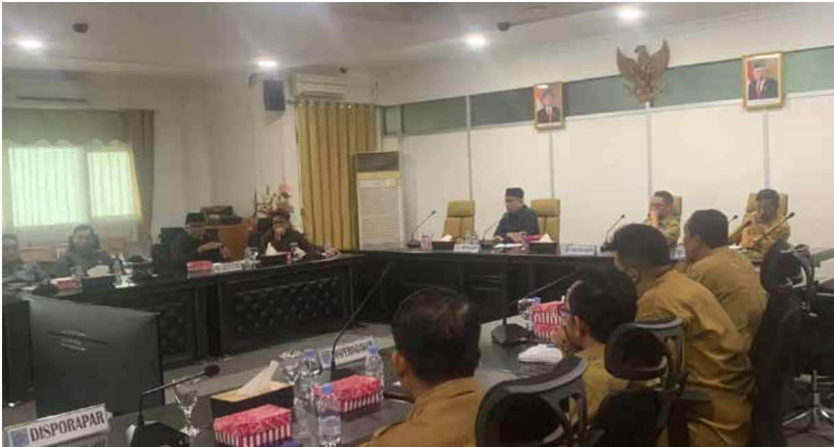
RDP di Sekretariat DPRD Kabupaten Paser