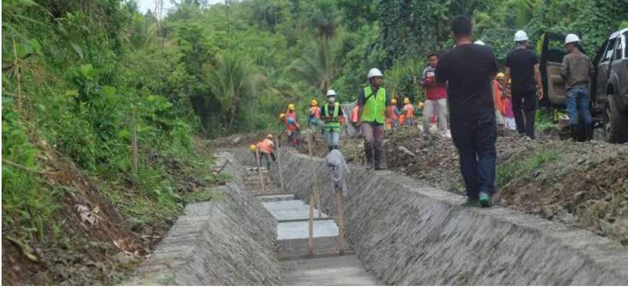
Ilustrasi. Suasana pembangunan jaringan irigasi pertanian. (Istimewa)