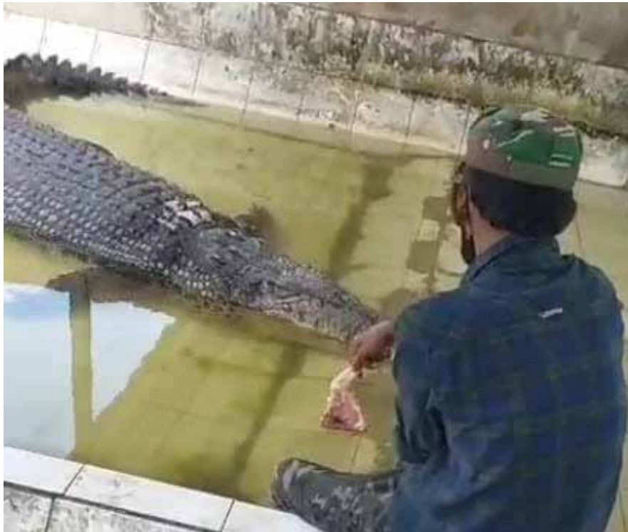
Ambo saat melihat Buaya Riska di Penangkaran Buaya Tritip Balikpapan, Kamis (5/10).