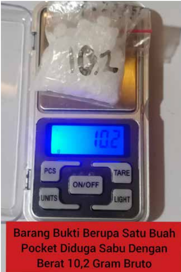
Barang Bukti Berupa Satu Buah Pocket Diduga Sabu Dengan Berat 10,2 Gram Bruto