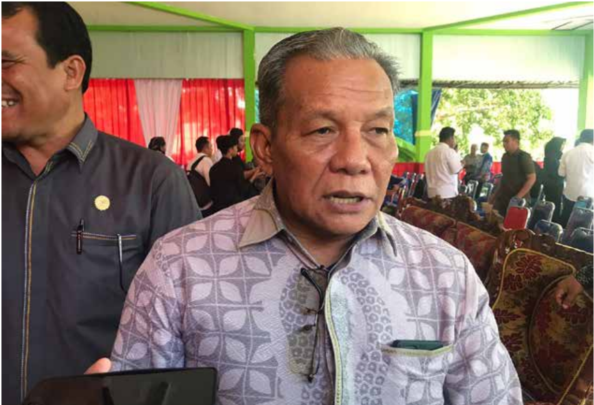
Ketua Komisi III DPRD Berau, Saga.