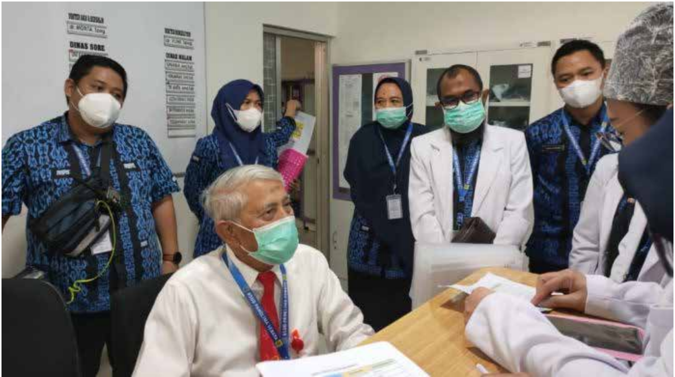
Peninjauan lapangan oleh KARS di RSUD Panglima Sebaya