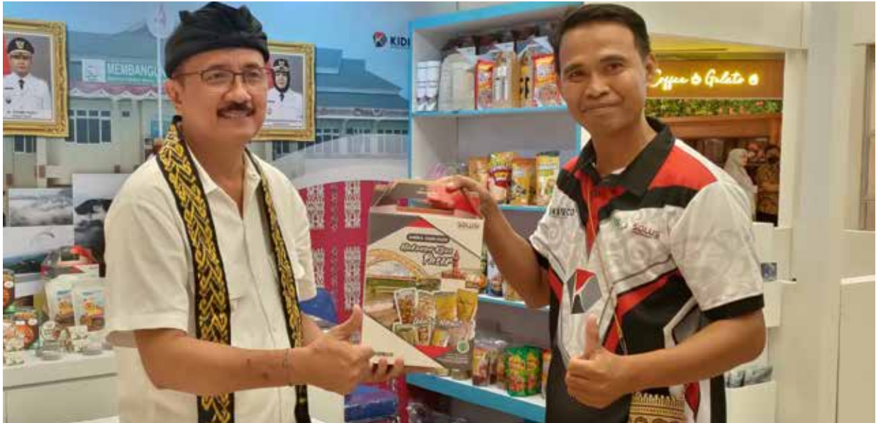
Gerai UMKM Kabupaten Paser di Indokraf Expo 2023