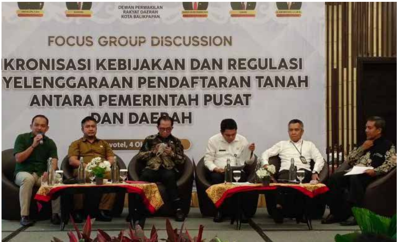
DPRD Balikpapan saat menggelar FGD Sinkronisasi Kebijakan dan Regulasi Tanah.