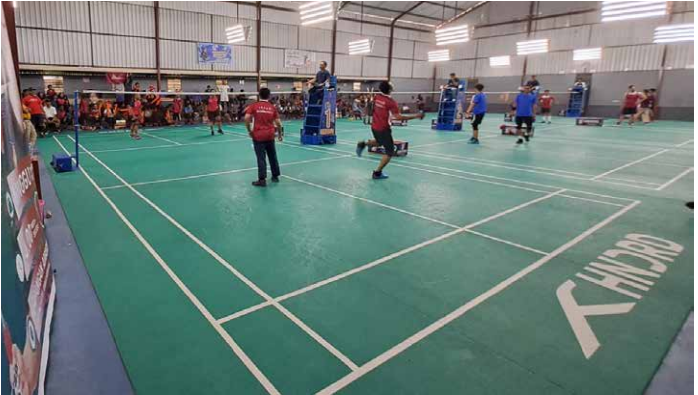
Peserta Badminton Turnamen 2023 dalam rangkaian HUT ke-21 RSUD Bontang. (Yahya Yabo)