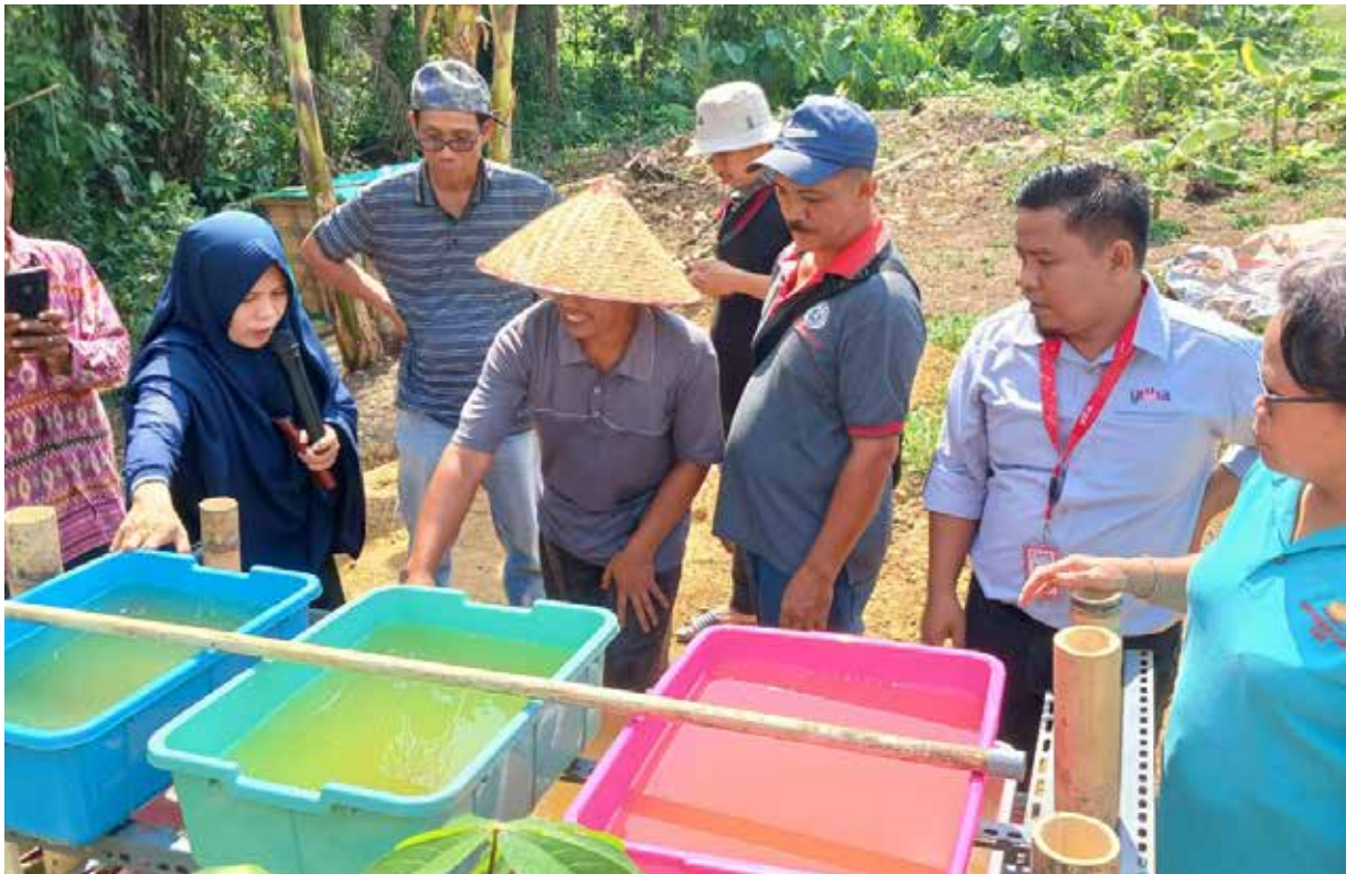
Proses budidaya cacing sutra