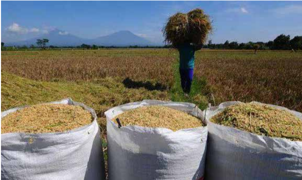
Ilustrasi Gabah Hasil Panen Petani