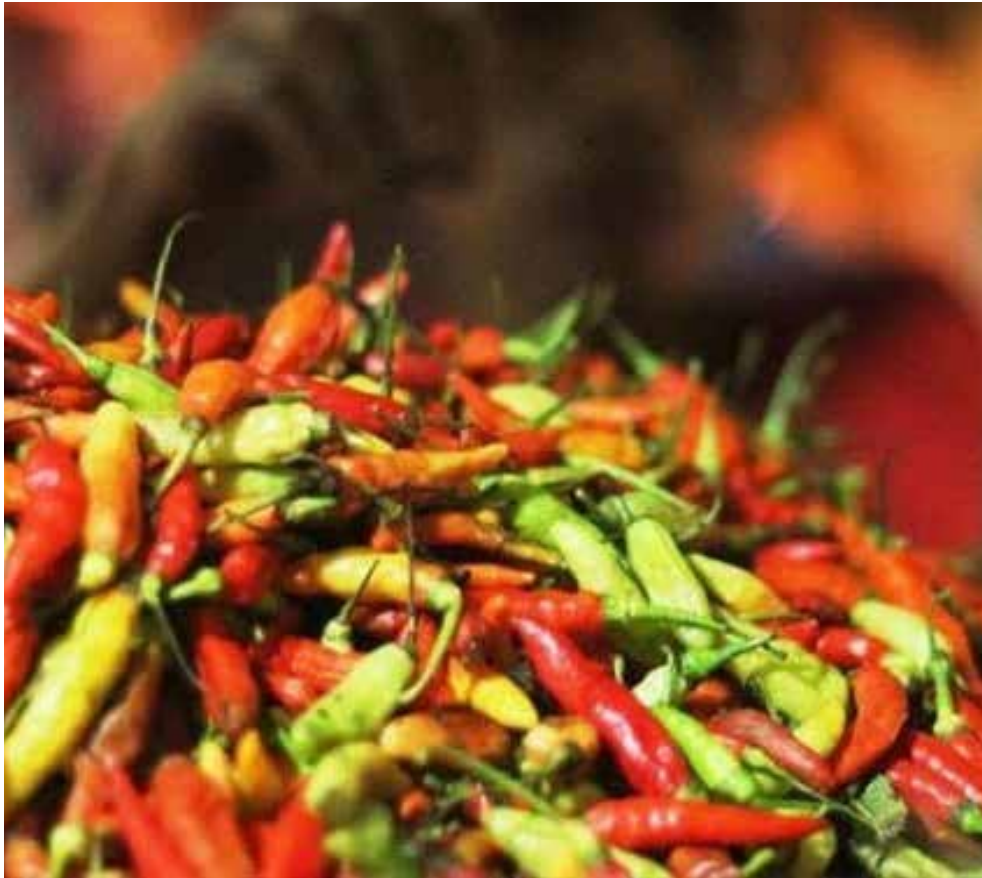
Ilustrasi cabai. (ist)