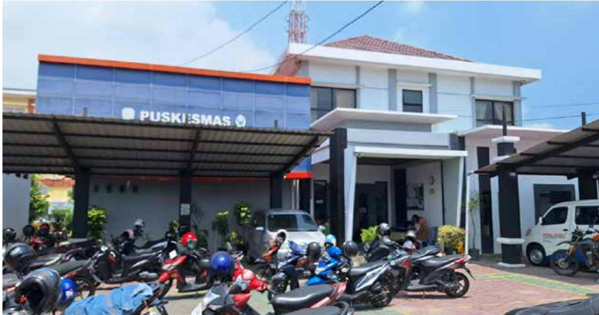
Puskesmas Bontang Utara II. (Yusva Alam)