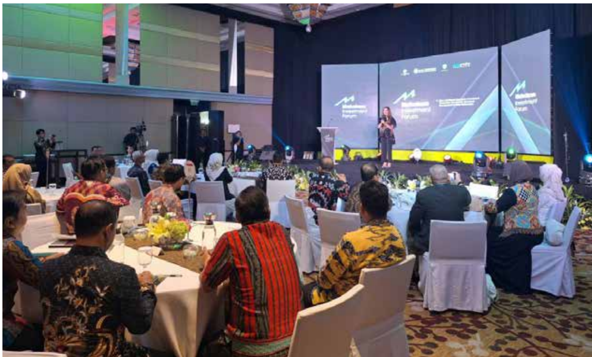
Mahakam Investment Forum (MIF) yang digelar DPMPSTP dan KPw BI Kaltim beberapa waktu lalu