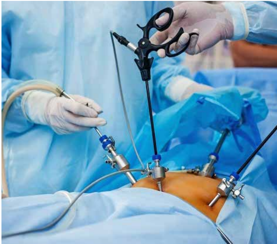
Ilustrasi alat operasi laparoskopik oleh dokter. (ist)