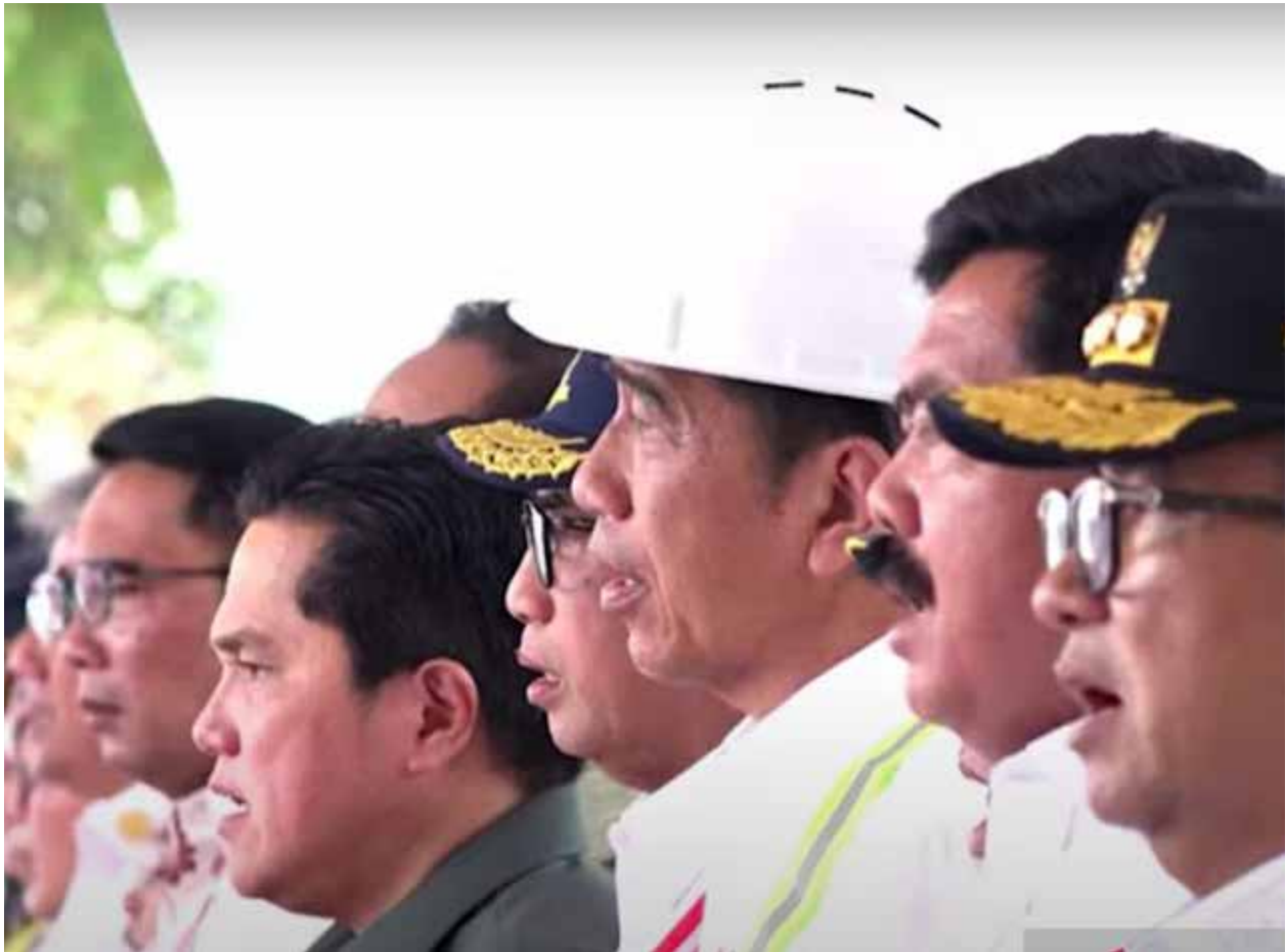
Presiden Joko Widodo (ketiga kanan) bersama para menteri Kabinet Indonesia Maju, kepala daerah, dan Mantan Gubernur Jawa Barat Ridwan Kamil saat “groundbreaking” pembangunan Bandara Ibu Kota Nusantara (IKN) di Penajam Paser Utara, Kalimantan Timur, Rabu (1/11/2023).