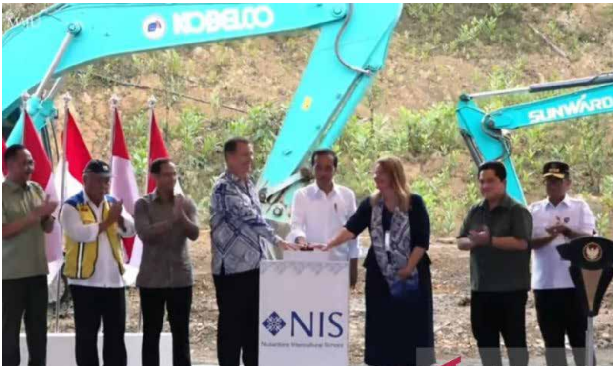
Presiden RI Joko Widodo meresmikan groundbreaking proyek sekolah internasional di kawasan IKN, Kalimantan Timur, seperti disaksikan dalam video dari Jakarta, Rabu (1/11/2023).