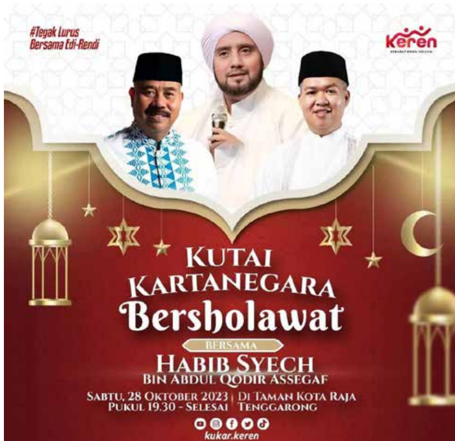
Flyer Kukar Bersholawat Jilid II yang akan dipandu Habib Syech bin Abdul Qodir Assegaf.