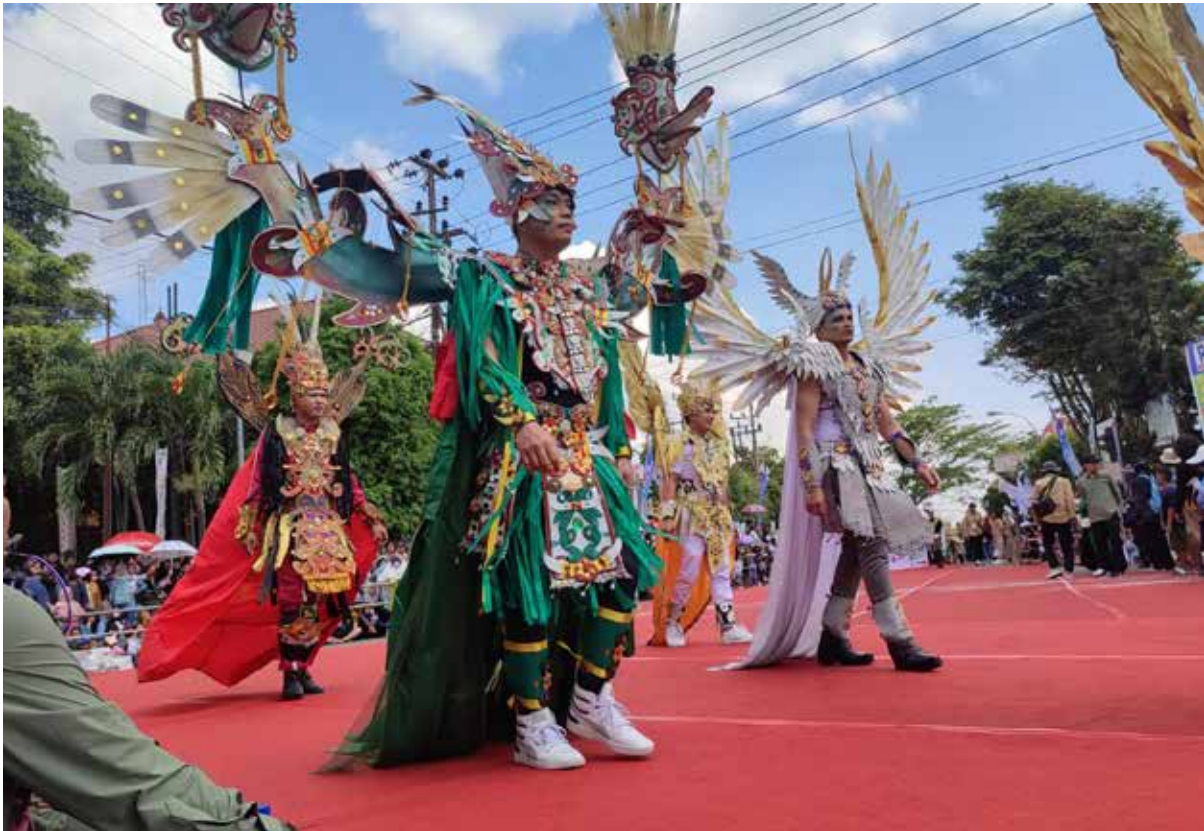
Penampilan salahsatu peserta BCC 2023 Kota Bontang.