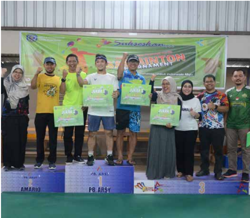
Para pemenang turnamen saat menerima hadiah. (ist)