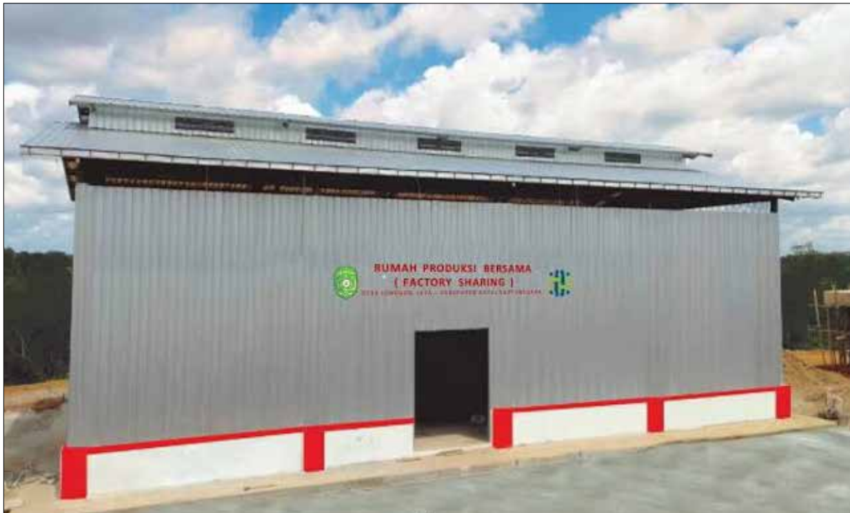
Gambaran RPB jahe yang dibangun di Desa Jonggon Jaya.