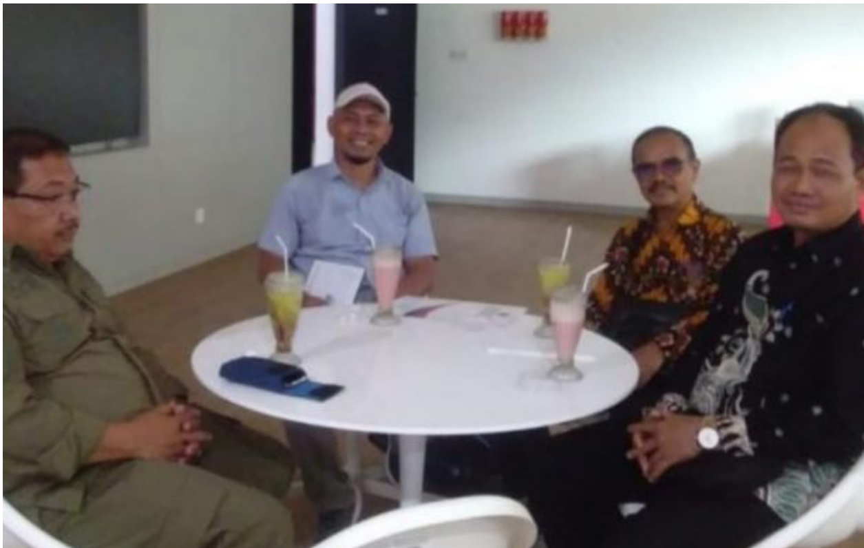
Susun perencanaan pelaksanaan diklat di Kabupaten Paser