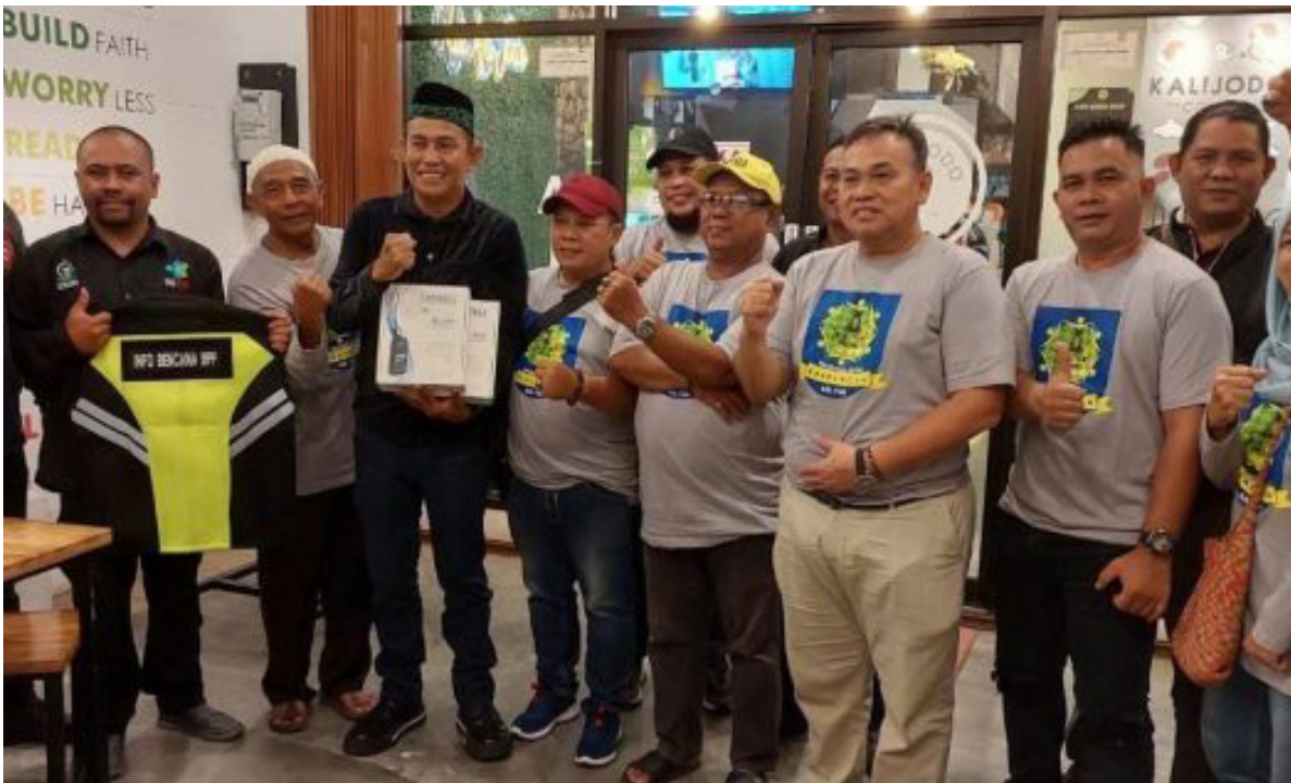
Kerukunan Juriat Kandangan Kaltim saat memberikan bantuan rompi dan HT kepada relawan Info Bencana.