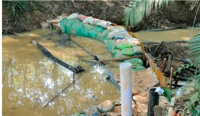
PAM Danum Taka for MediaKaltimGroup

"Jika tidak, maka tidak akan ada air yang dapat kami olah. Oleh karena itu, saat ini kami harus membendung air yang tersisa sebagai langkah jangka pendek,"