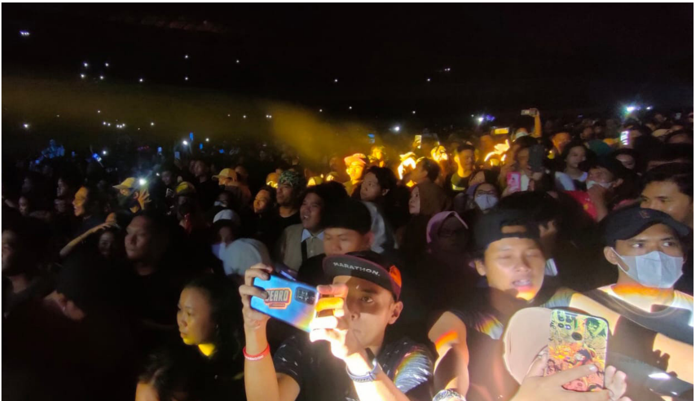
Suasana KukarLand Festival 2023.

Pemulis : Ady Wahyudi Editor : Muhammad Rafi'i