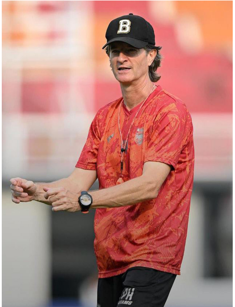
Tak ingin anggap remeh PSM Makassar meski mereka recovery singkat.

"Pertama-tama, itu telah terjadi tiga hari yang lalu dan mereka mempunyai waktu untuk beristirahat dan mempunyai waktu untuk pemulihan dari pertandingan itu. Tapi, tentu saja kami juga melihat pertandingan itu dan kami tahu PSM dan mengetahui permainan mereka," bebernya.