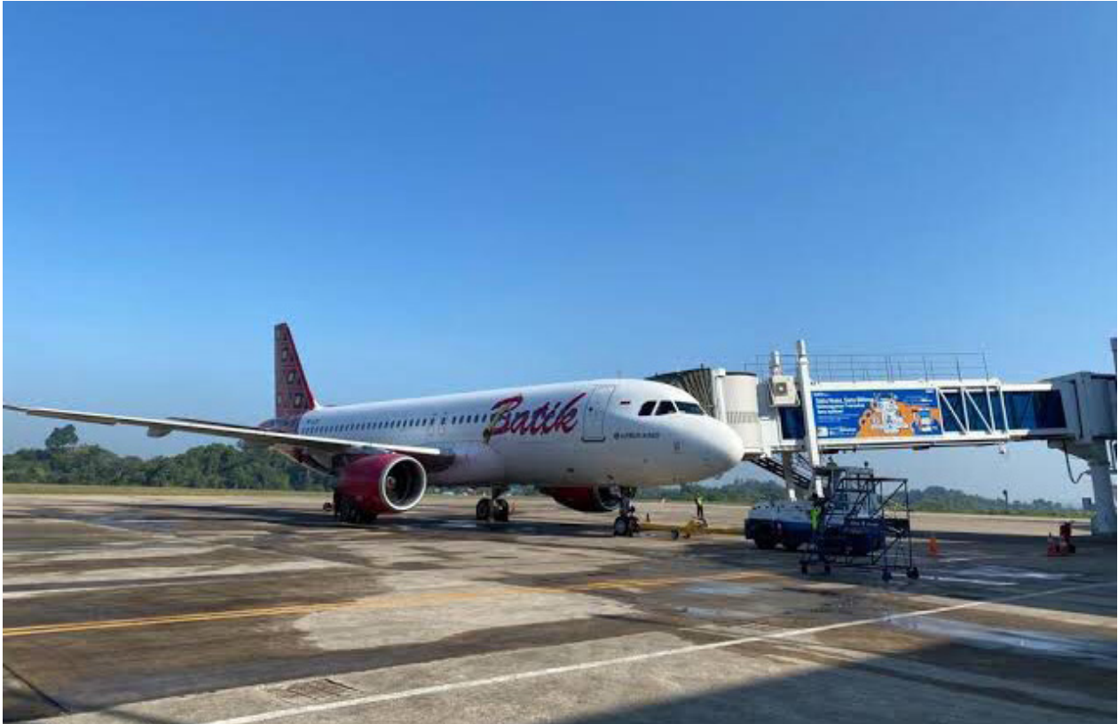
Pesawat Batik Air saat mendarat di Bandara Kalimarau.