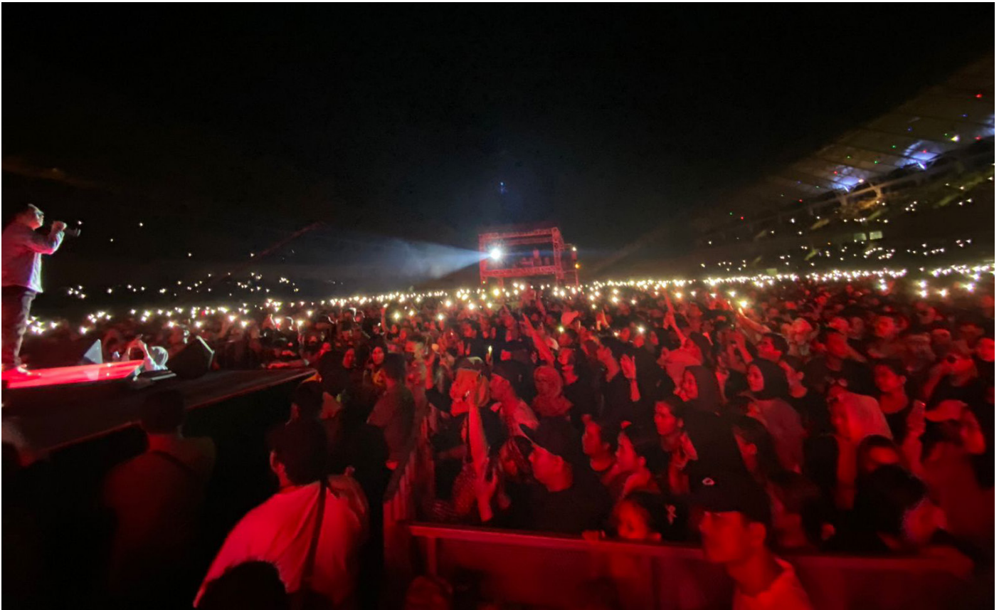
Lautan penonton di KukarLand Festival 2023.