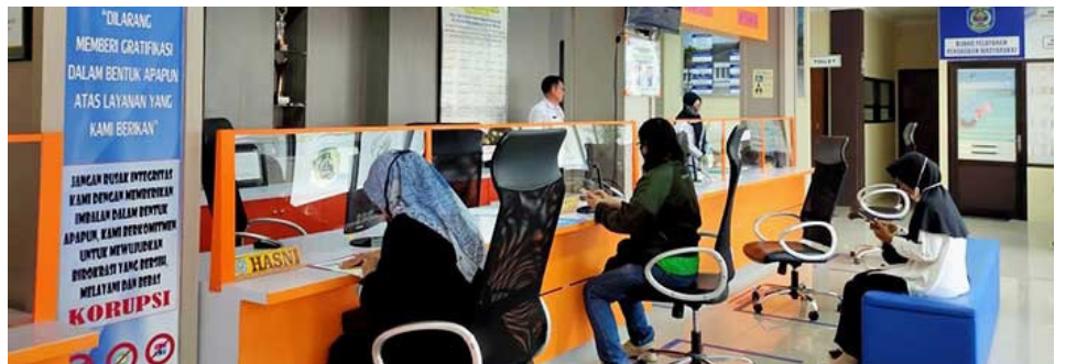
Ilustrasi pengurusan IMB di DPMPSTP Bontang.

Dijelaskannya, sebenarnya lambannya pengurusan IMB bukan terletak pada Pemkot Bontang melalui dinas-dinas terkait, na-