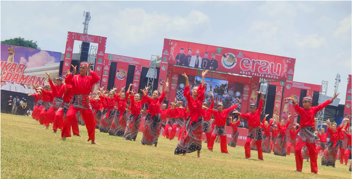
Tarian massal dari rangkaian pembukaan Pesta Erau Adat Pelas Benua di Stadion Rondong Demang Tenggara.