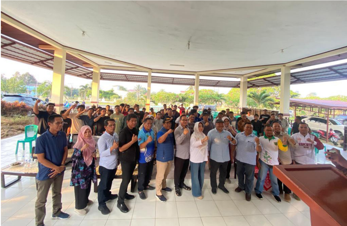
Foto bersama setelah pembukaan Pesisir Tournament Esi Berau tahun 2023 di Kecamatan Biatan.