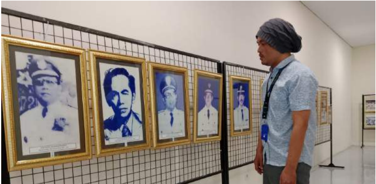
Seorang Pengunjung Melihat Foto Bersejarah Kota Samarinda. (Hanafi)