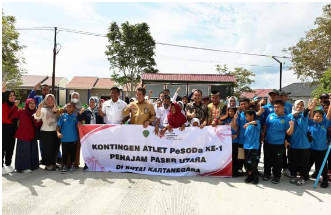
Momentum pelepas atlet SOIna oleh Disdikpora PPU.