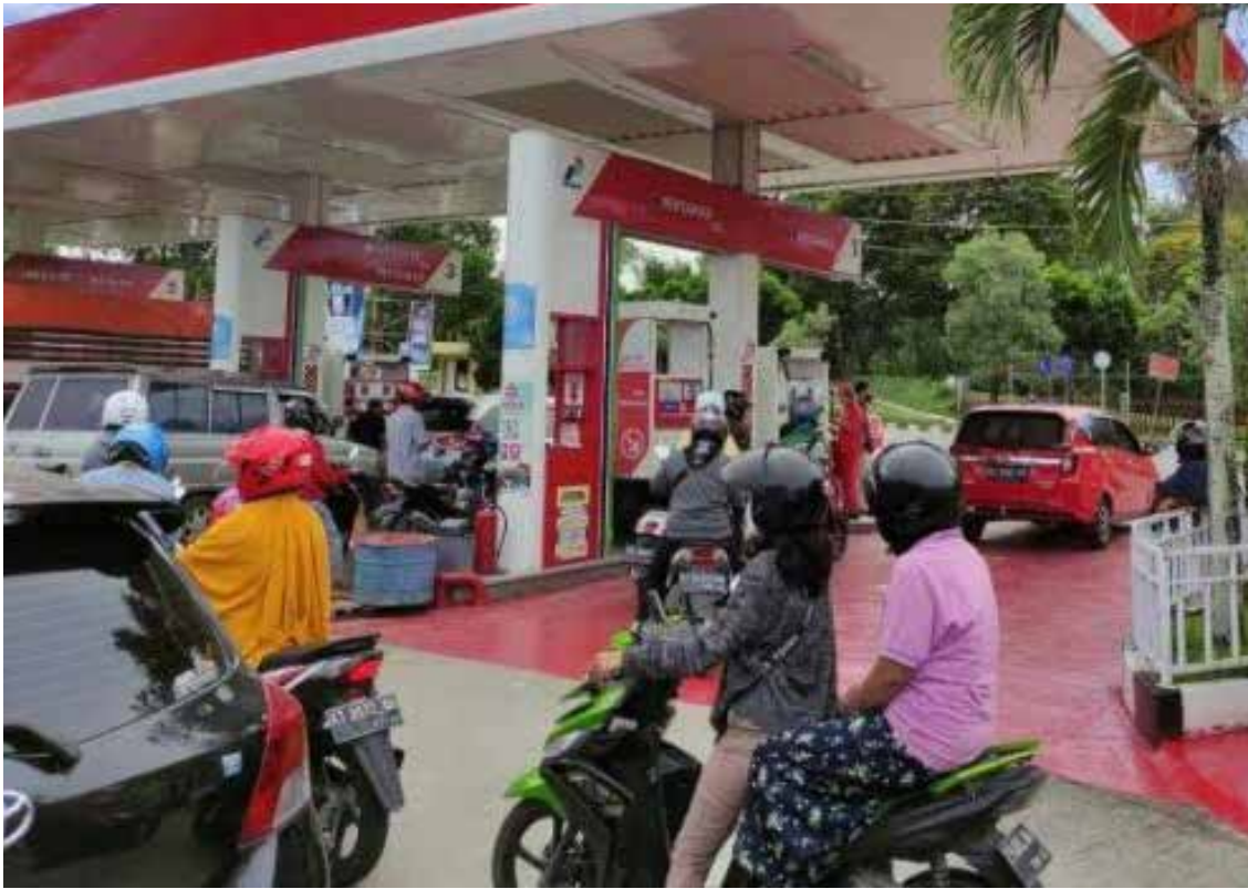
Antrean panjang di salah satu SPBU di Kaltim