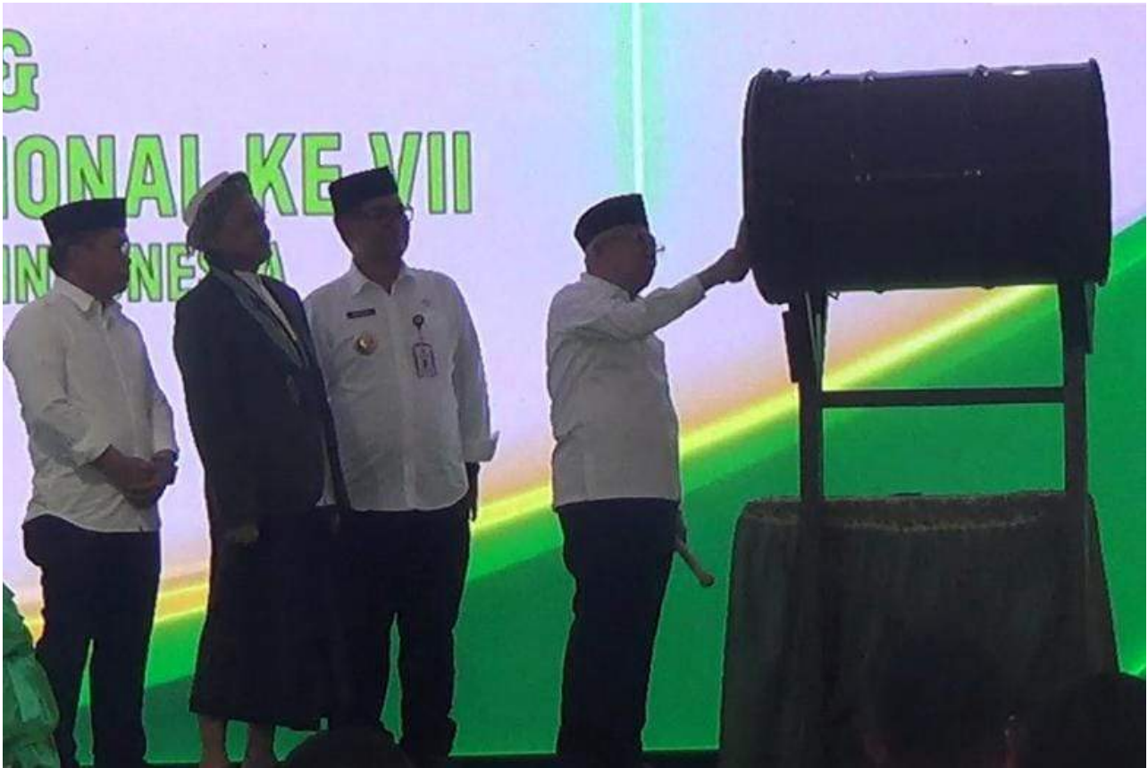
Wakil Presiden RI, Ma'ruf Amin saat membuka Silaturahmi Nasional (Silatnas) ke-VII Kontak Santri Agribisnis Indonesia (Konsain) di Pondok Pesantren Syaichona Cholil, Selasa (24/10).