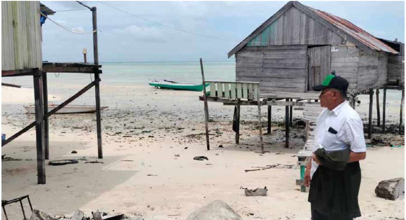
Ketua Komisi III DPRD Berau, Saga saat meninjau kondisi abrasi Pulau Balikukup.