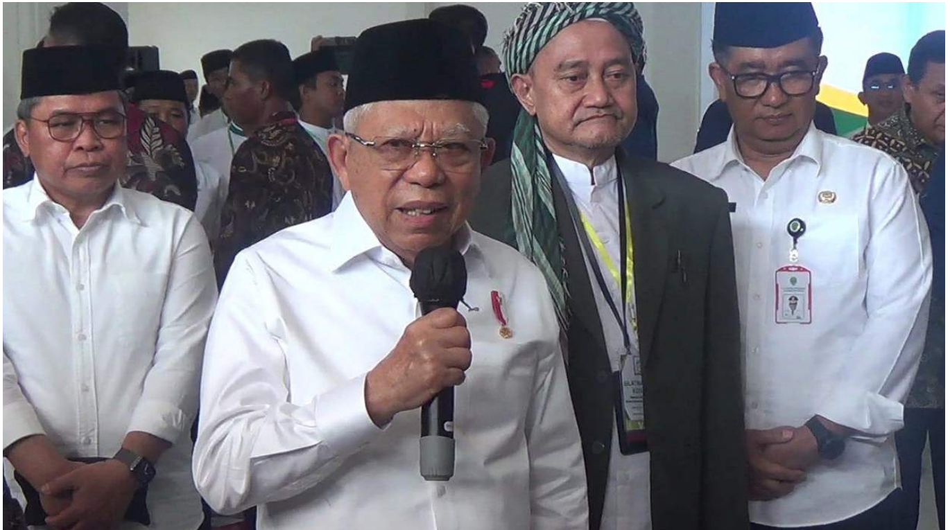
Wakil Presiden RI, K.H Ma'ruf Amin