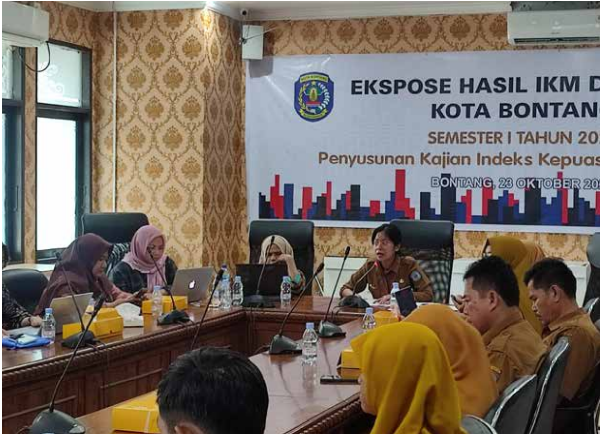
Ekspose hasil IKM DPMPTSP semester I tahun 2023.