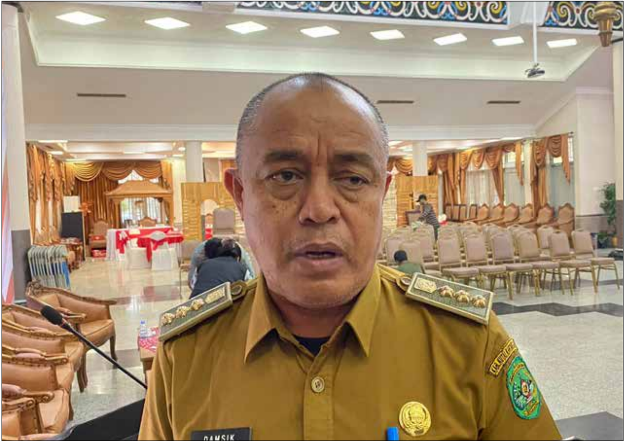
Camat Samboja, Damsik. (Ady/Wahyudi)