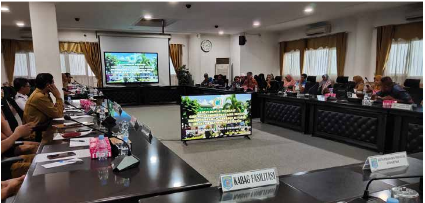
RDP dengan pedagang serta OPD terkait