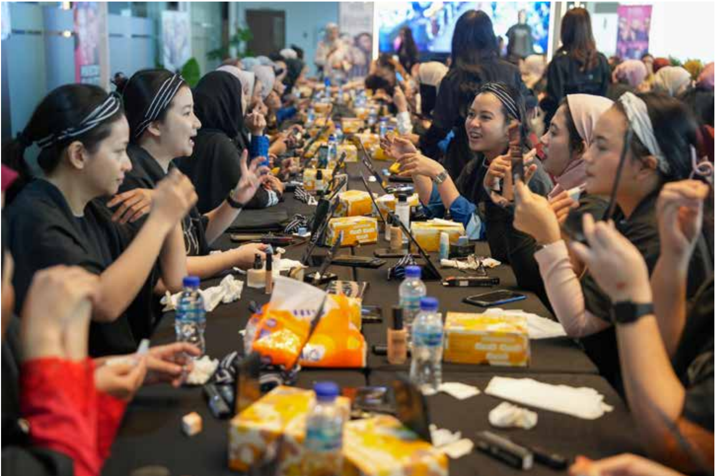
Sejumlah pekerja wanita dan istri pekerja KPB mengikuti Beauty Class x Make Over.