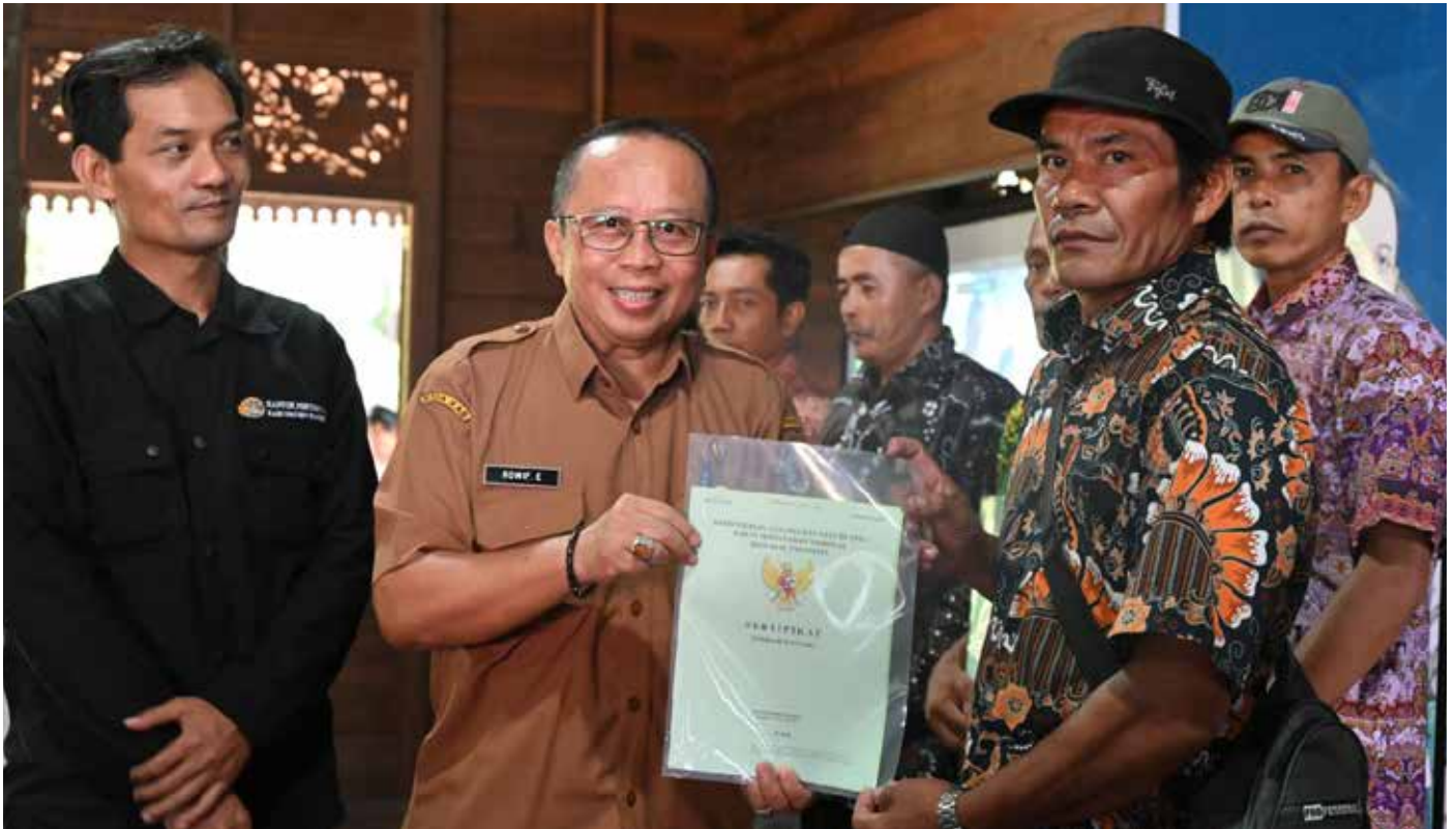
Penyerahan sertifikat program Gerakan Sinergi Reforma Agraria Nasional 2024