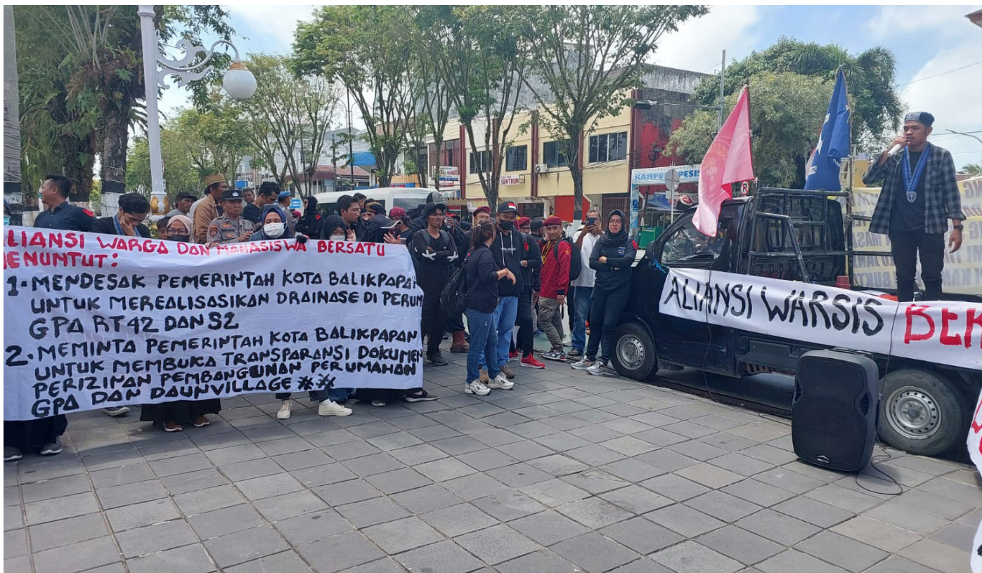
Aksi demo warga GPA RT 42 dan RT 52 Kelurahan Gunung Bahagia, Balikpapan Selatan di depan kantor Wali Kota Balikpapan.