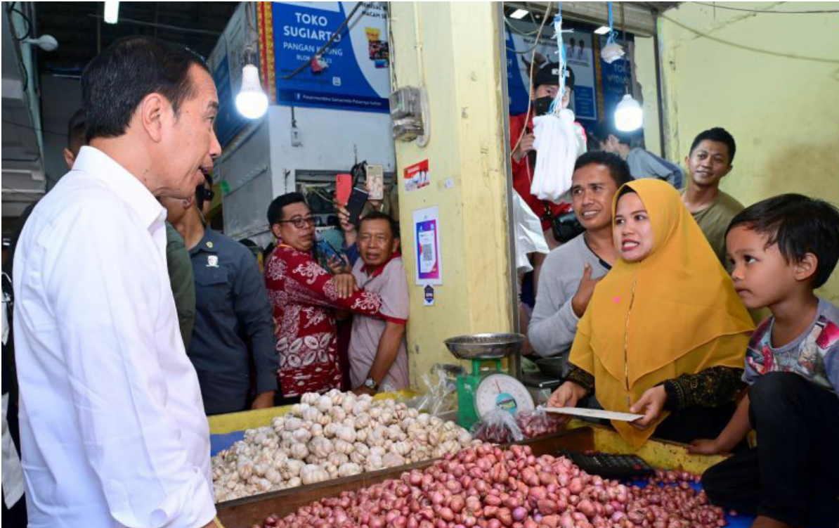
Presiden Joko Widodo meninjau pasokan dan harga kebutuhan pokok di Pasar Merdeka, Samarinda, Kalimantan Timur, Kamis (21/9/2023).