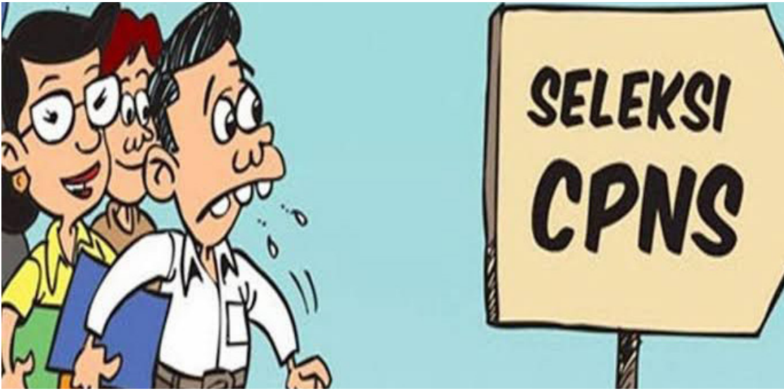
Ilustrasi penerimaan Pegawai PPPK.