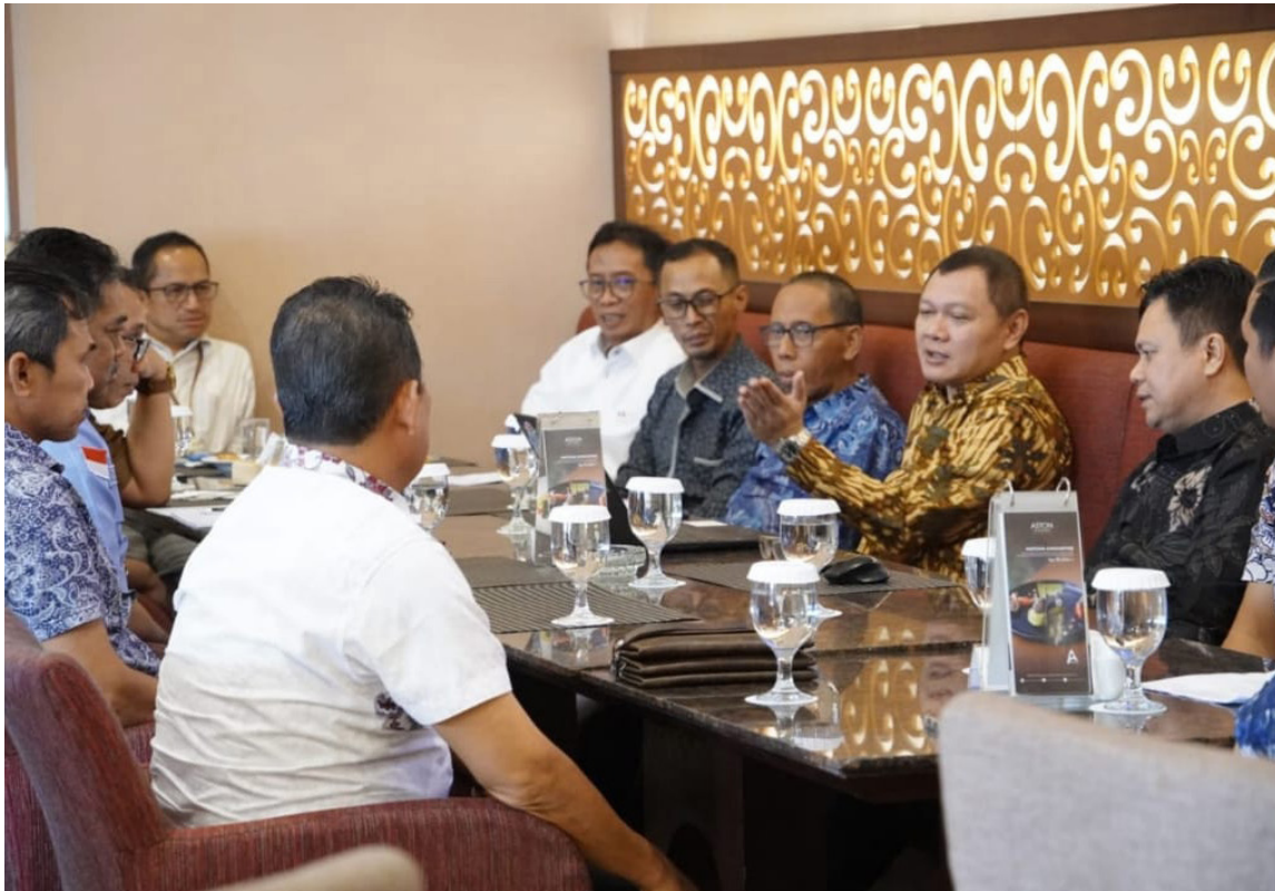
Pertemuan persiapan pencaanangan Porprov Kaltim