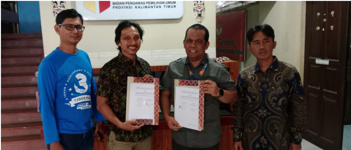
Rangkaian Kerjasama Media Kaltim Grup dan Bawaslu Kaltim .