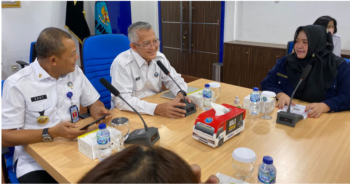
Ketua BNK Paser saata di BNN RI bersama Kepala BNNP Kaltim