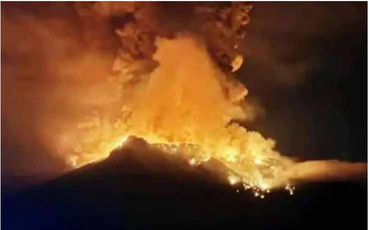
Gunung Ruang Saat Meletus