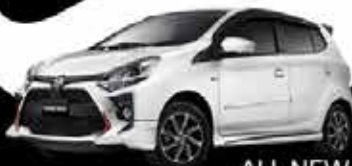
ALL NEW AGYA