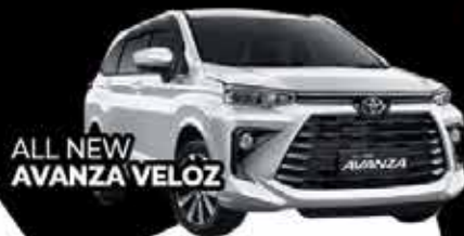
ALL NEW AVANZA VELOZ