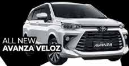
ALL NEW AVANZA VELOZ