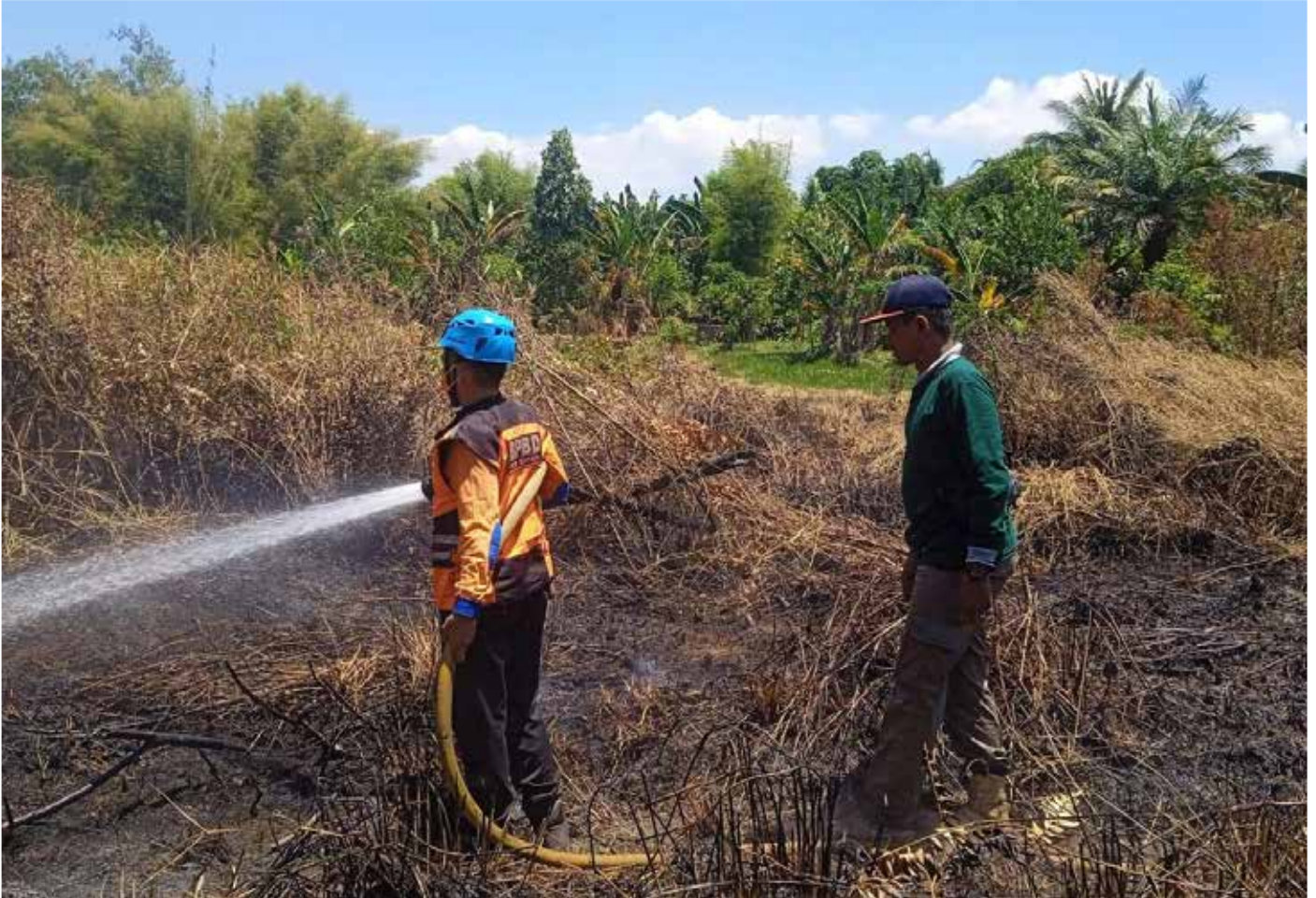
Petugas melakukan pemadaman api di lahan perumahan BTN PKT. (Dok. BPBD Bontang).