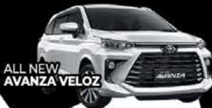
ALL NEW AVANZA VELOZ