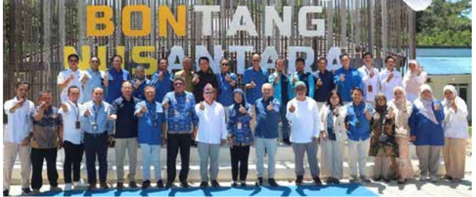
Peresmian nama Bontang Nusantara menggantikan nama Bontang Kuring Resto. (ist)

paikan Wali Kota kepada PT KMBU. Karena Bontang akan menyambut Ibu Kota Nusantara (IKN). Terlebih, mulai Juli 2024 ini akan mulai ditempati, sehingga Bontang Nusantara perlu disiapkan di Bontang sebagai kota penyangga IKN.