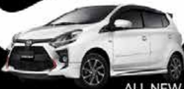
ALL NEW AGYA