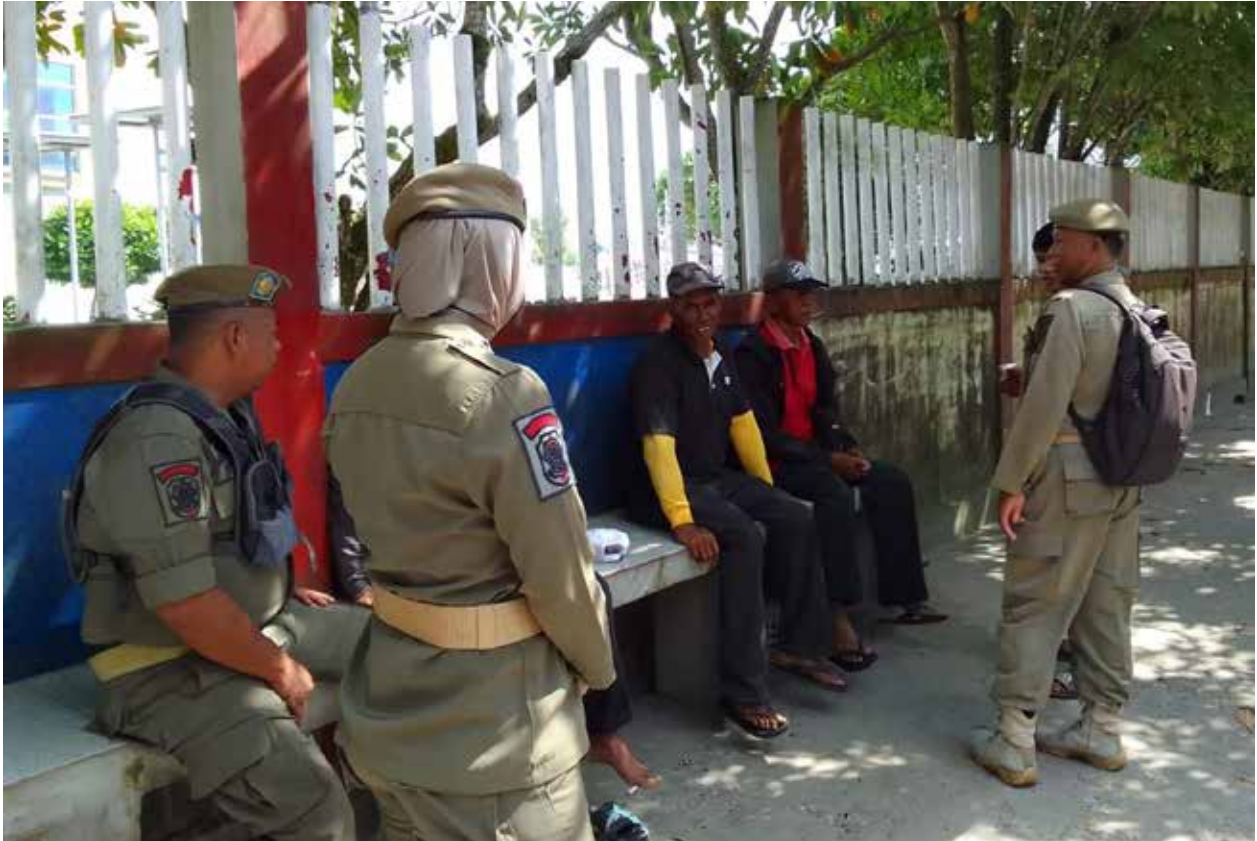
Personel Satpol PP PPU saat melakukan pengamanan di kawasan Pelabuhan Penajam.