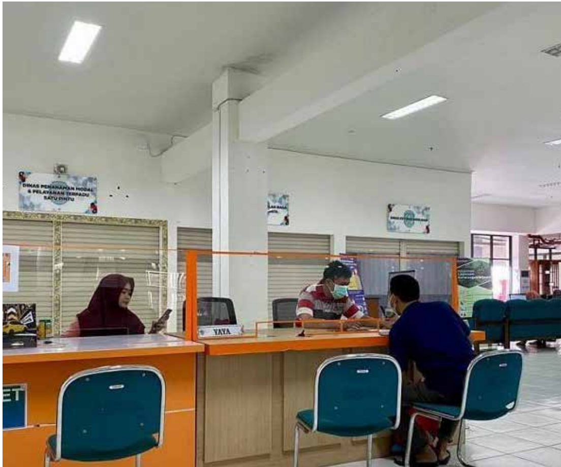
Pelayanan di MPP Bontang.