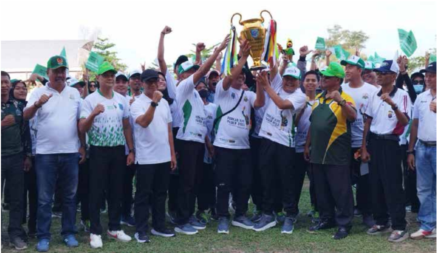
Penutupan Porkab ke 17 Paser