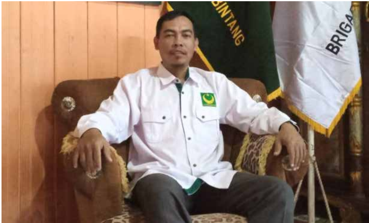
Sekretariat DPRD Kabupaten Paser