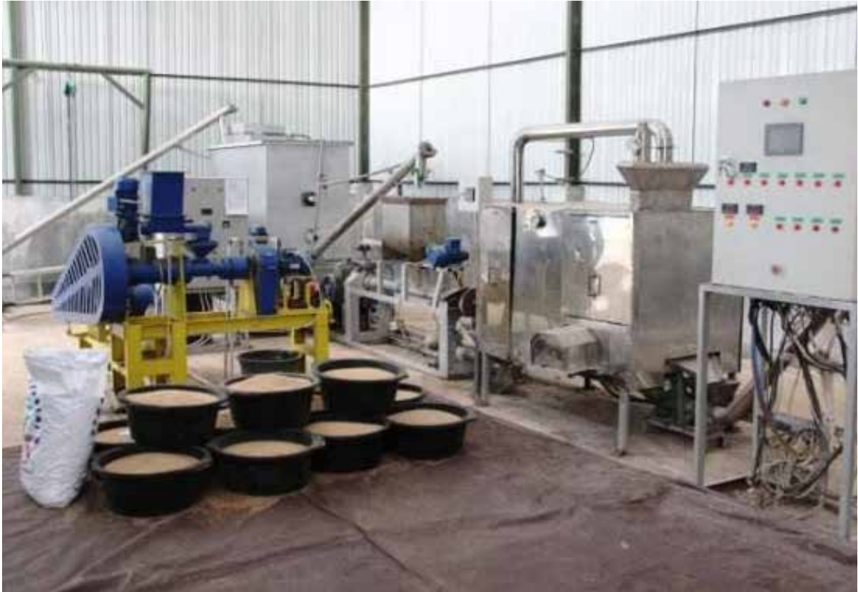
Ilustrasi pabrik pakan ikan