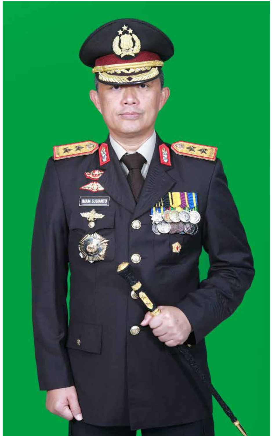
Kapolda Kaltim, Irjen Imam Sugianto yang akan mutasi menjadi Kapolda Jawa Timur.