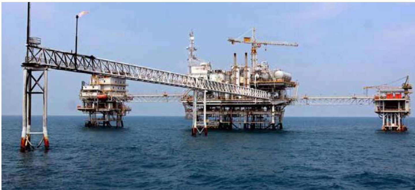
Ilustrasi ladang gas bumi di laut lepas.