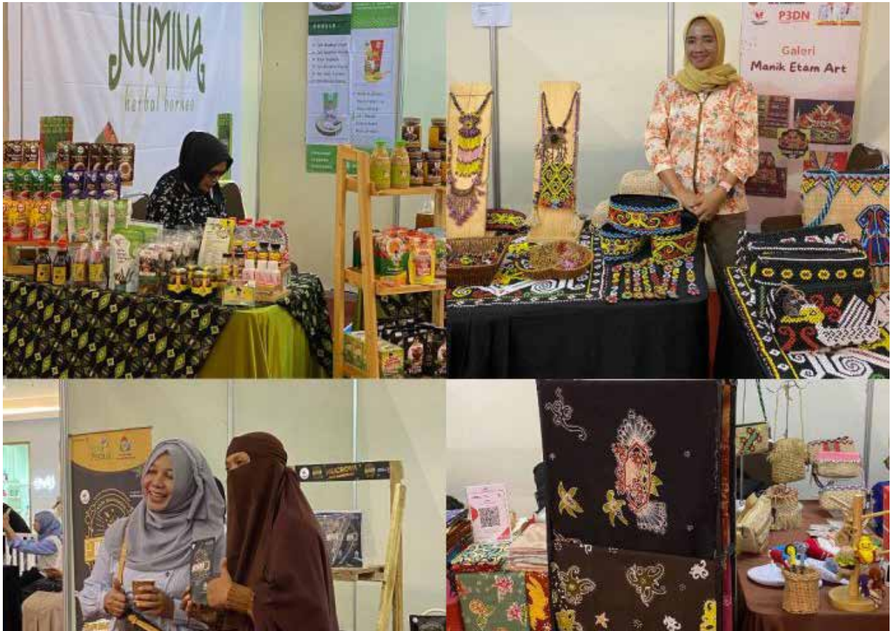
Expo UMKM Gadepreneur di Pekan Raya Pegadaian