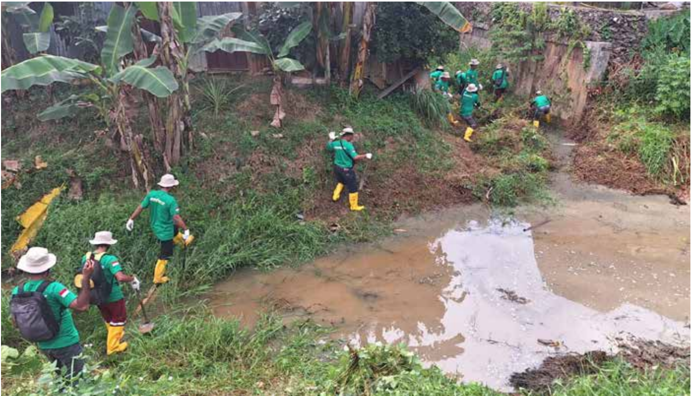
PHL di Dinas PUPRK saat mengerjakan normalisasi sungai beberapa waktu lalu.