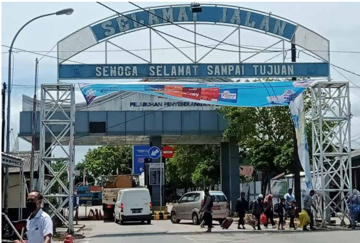
Pintu Gerbang Kabupaten Penajam Paser Utara