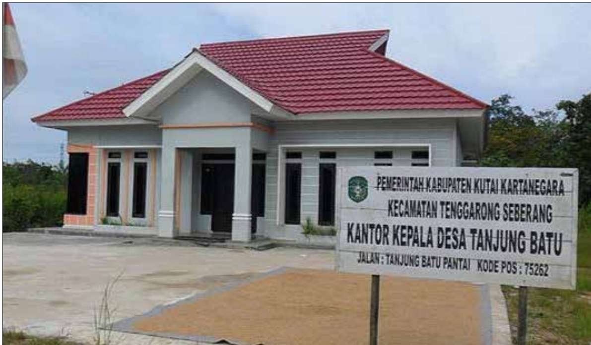
Kantor Desa Tanjung Batu. (Istimewa)