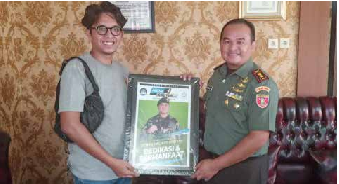
Berbalas cinderamata bersama Dandim 0904/PSR