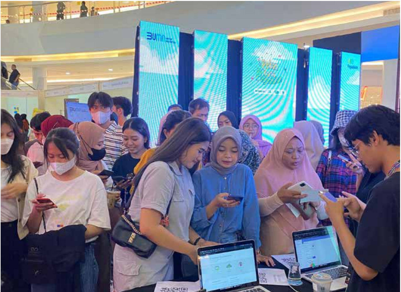
Pengunjung Pekan Raya Pegadaian di Bigmall Samarinda