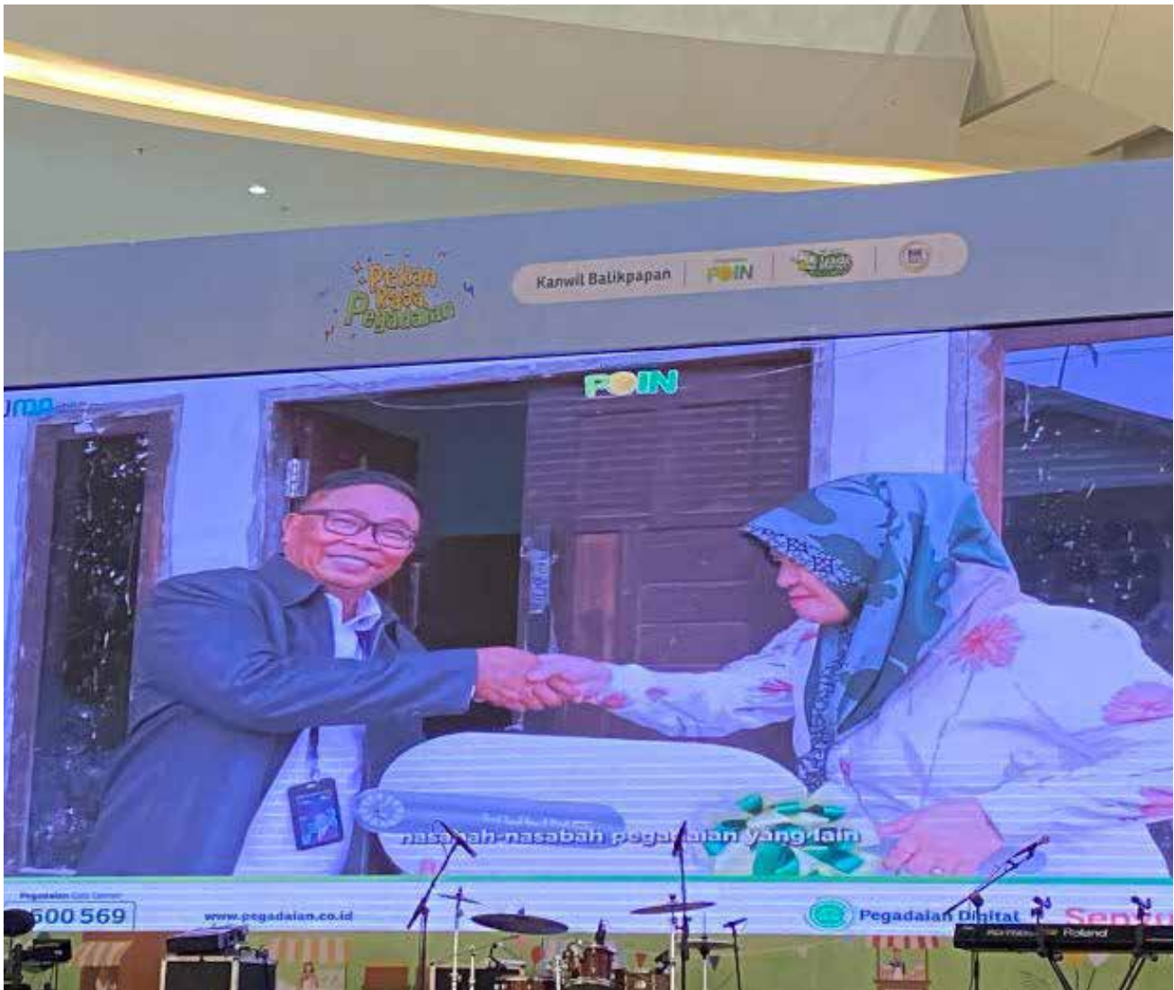
Pemenang Pegadaian Poin Kantor Wilayah IV Balikpapan