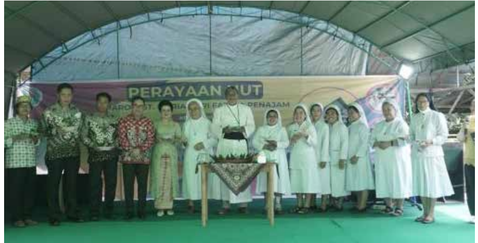
Perayaan HUT ke-23 Paroki Santa Maria dari Fatima di Penajam.